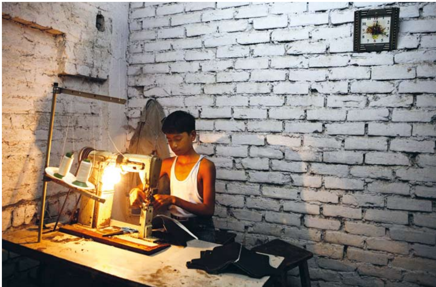
Fingernem Arbeidende i et mellomstort fabrikklokale i Jajmau, syr en barnearbeider deler av hva som til slutt skal bli ulike skinnartikler. Gutten fortsetter å jobbe mens de fleste andre har gått til lunsj.