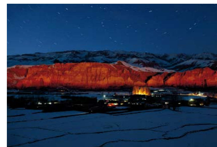
Magisk lys Klippene der de to gigantiske Buddha-statuene en gang sto, fotografert om natten fra en motstående fjellside ved Bamiyan, i sentral-Afghanistan. Skyggene av de to tomme hullene der buddhaene sto, sees tydelig på hver side av den avbildede delen av fjellsiden.

I løpet av de siste årene har provinsforvaltningen og menneskerettighetsorganisasjoner ofte lovet beboerne her at de ville bygge hus eller i det minste fordele jordstykker og stille byggmaterial til rådighet. Men så langt har Afghanistans uavhengige menneskerettighetskomisjon bare utført en foreløpig undersøkelse, og vurdert behovene til de fattigste familiene.