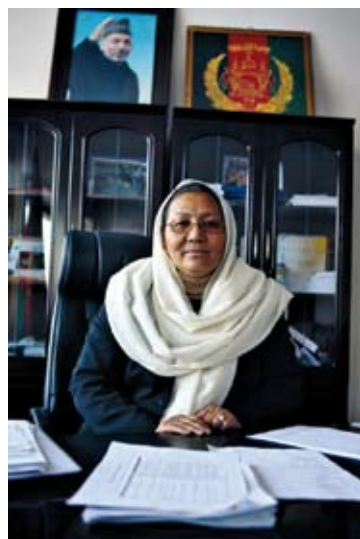
Pioner Habiba Sarabi (54) er guvernør i Bamiyan-provinsen. Hun ble utnevnt til stillingen av president Karzai i 2005, som første og hittil eneste kvinnelige guvernør i Afghanistan. Sarabi taler hazaraenes sak.

Buddhas øyne. Mange tror Taliban sprengte statuene ikke fordi de anså dem for ikke-islamske «idoler», men heller for å utarme et område bebodd av en etnisk gruppe de betraktet som «ikke-afghansk». De ville forhindre at hazaraene kunne nyte godt av sin verdensberømte kulturarv og det store turistpotensialet som lå her. «Taliban var mot hazara-folket, de ville ødelegge historien vår,» sier Habiba Sarabi, Bamiyan-guvernør, den første og hittil eneste kvinnelige guvernør i Afghanistan.