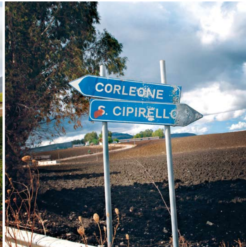
En evig mafialegende Corleone er hjembyen til Bernardo Provenzano og Totò Riina, to av de farligste og mest kjente mafiasjefene noensinne. Dette skiltet som viser vei til byen er gjennomhullet av skudd og minner besøkende om den blodige historien.