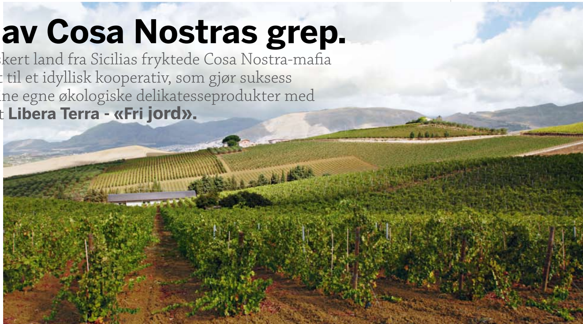
Fra blodige åsteder til idyll Til nå har rundt halvparten av de 8000 eiendommene (land, bygninger, kjøretøy o.s.v.) som er konfiskert fra mafiaen blitt tildelt ulike organisasjoner som tar dem i bruk for samfunnsnyttige formål.

Konfiskert land fra Sicilias fryktede Cosa Nostra-mafia er blitt til et idyllisk kooperativ, som gjør suksess med sine egne økologiske delikatessprodukter med navnet Libera Terra - «Fri jord» .