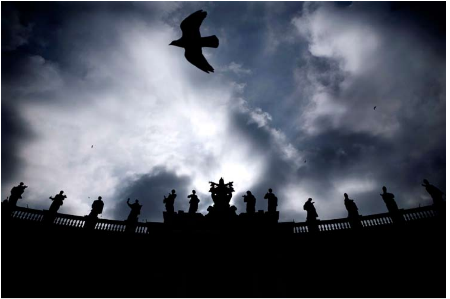
HOVEDSETET: Det er her, i Vatikanet, at reglene for eksorsisme vedtas. De ble sist revidert i 1999.