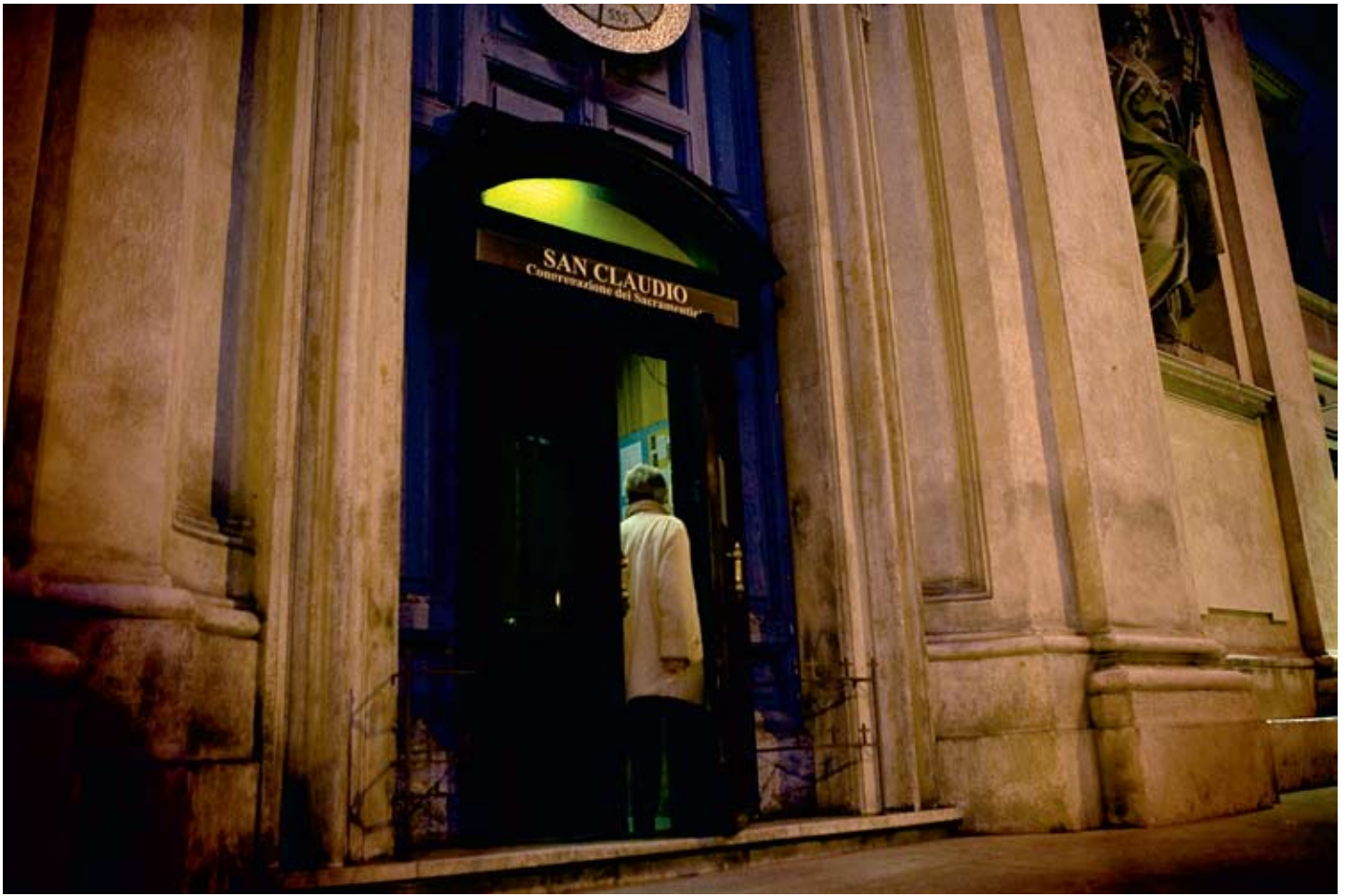
HÅPETS DØR: San Claudio-kirken ligger midt i Romas travleste handlestrøk. I bakrommene utfører prestene eksorsisme.