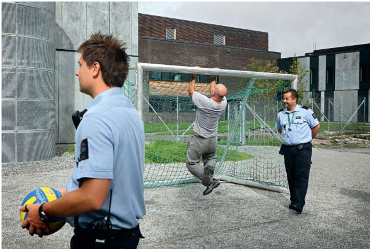
FELLESSKAP: Blandede lag med innsatte og ansatte spiller fotball, volleyball og basketball utendørs.

☞ – Tenk hvordan det blir om vi skal la disse sone i Halden fengsel. Ryktet om hvor fint og luksuriøst det er, vil spre seg fort, og vi vil få enda flere utenlandske bander til Norge.