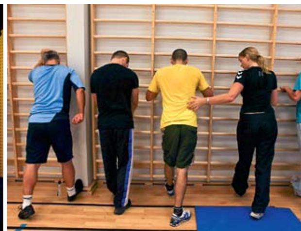
INGEN RAMBO: Fritidstilbudet inkluderer mye fysisk aktivitet, selv om løse vekter er forbudt.