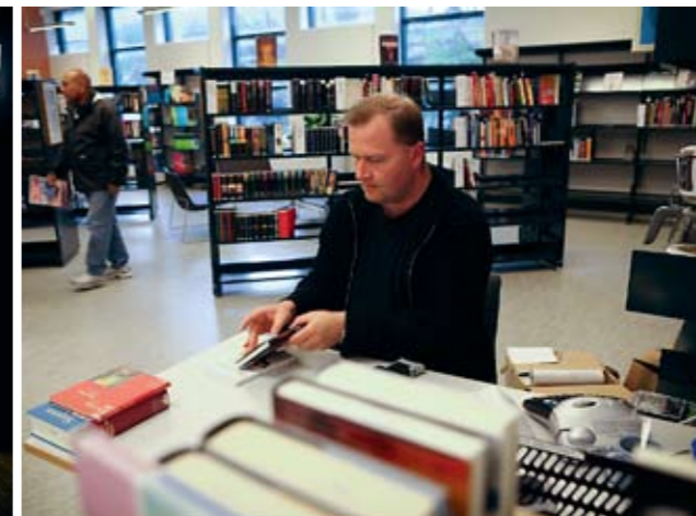
MATLYST: Kokebøker topper bibliotekets utlånsliste.