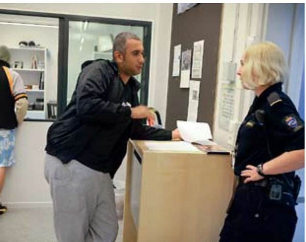
IVRIGE LESERE: Biblioteket har over 4000 bøker, DVD-er og CD-plater å velge mellom.

Undervisningen foregår i aktivitetssenteret, en kort spasertur fra boligavdelingene. Bolig-, arbeids-/skole- og fritidsbyggene ligger på forskjellige deler av den ca. 150 dekar