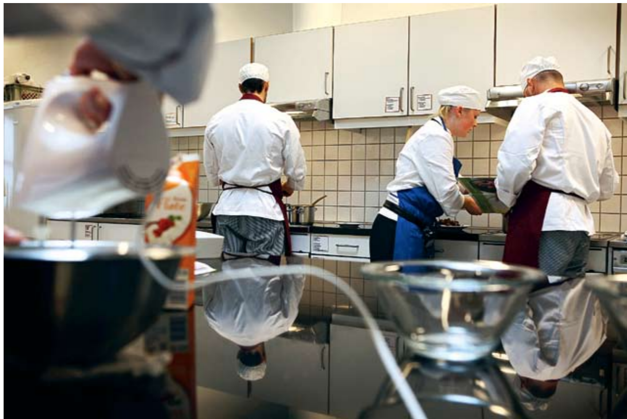
EKSOTISK KRYDDER: Flertallet av elevene på restaurant- og matfag har utenlandsk bakgrunn. De tar med seg litt av sin egen matkultur inn på kjøkkenet.

store tomten, slik at de innsatte må ut av boligene for å komme seg til skolen og derfra til fritidsaktivitetene.