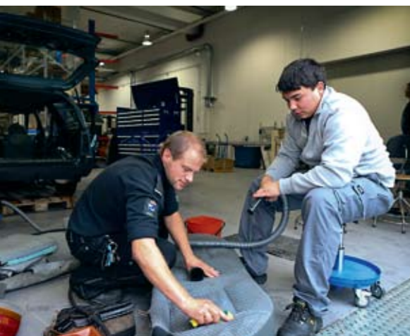
MILJØARBEID: Betjentene jobber skulder ved skulder med de innsatte i alle verkstedene.