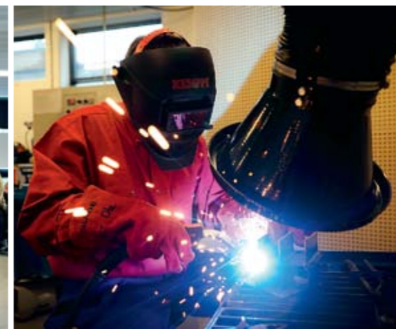
FAGBREV: Fengslets teknikk- og industriverksted er godkjent som opplæringsbedrift.