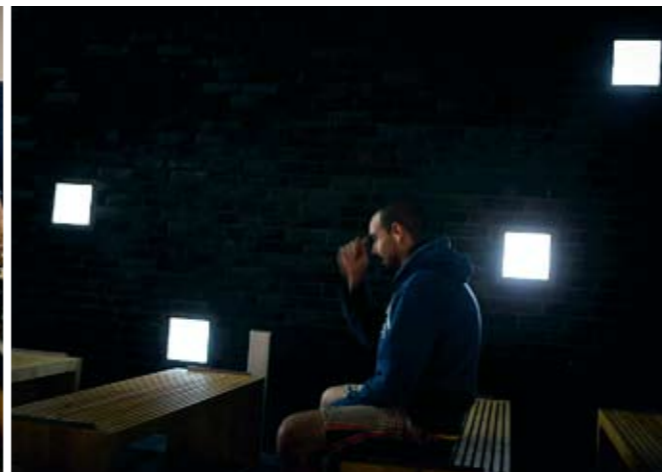
MULTIKULTURELT: Bønnerommet er uvigsløst og for alle.